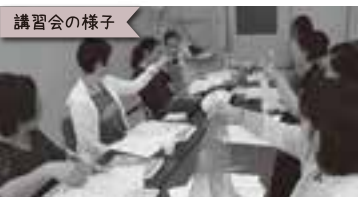
講習会の様子 皆様、とても真剣!!

利用料金 平日:700円/1時間 日曜・祝日:800円/1時間 ※登録料・年会費は無料