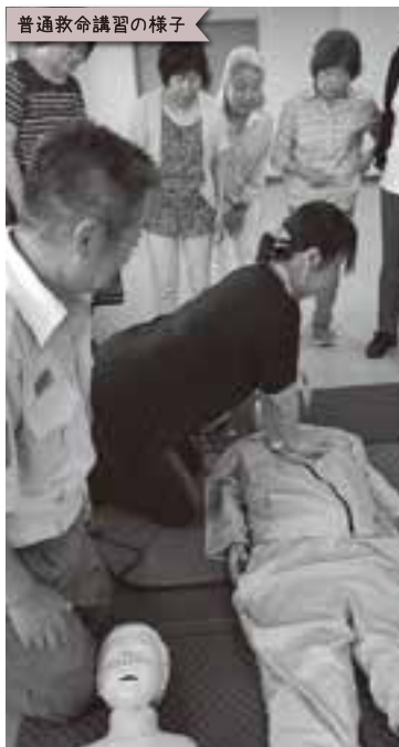
普通救命講習の様子 汗をかきながら、必死に胸骨圧迫の練習!!これで何かあっても対応できます!!