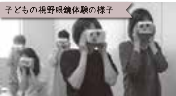
子どもの視野眼鏡体験の様子 「子どもってこんなに視野狭いんやね!!」と実感!!