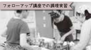
フォローアップ講座での調理実習 「ナン作るの初めてやけど、楽しいね♪これなら子どもと作れそう♪」