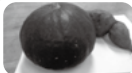
苑で採れた野菜です😊