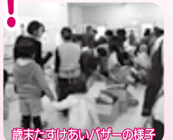
歳末たすけあいバザーの様子

今年「つながり ささえあう みんなの地域づくり」をスローガンに、社会的孤立の防止や、子ども達の学習支援サポート事業など、地域のつながりを強くするために、皆様のご協力のもと活動していきたいと考えています。