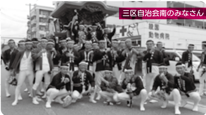
三区自治会南のみなさん

だんじり祭り関係者の人の絆を通し、住み慣れた地域で認知症の方やその家族を支え、 安心して一緒に生活できるような町づくり を支援しています。