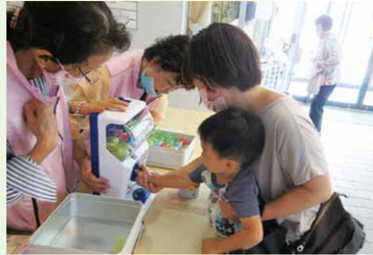
なにがあたるかな?