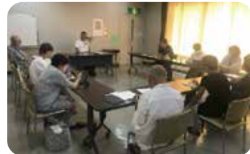
7月27日 パンセ羽衣公民館 定例役員会風景

新年度に入ると、総会、友愛訪問、賛助会員募集活動、サロン、歩こう会、賛助会員&福祉委員親睦会、委員研修会等の内容調整が多岐にわたります。また取りまとめる担当役員を決め、福祉委員