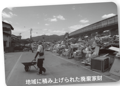
地域に積み上げられた廃棄家財