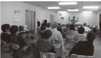
〔演芸サロン会-新公園管理事務所会議室にて〕