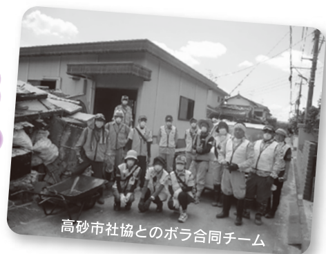
高砂市社協とのボラ合同チーム

8月7日、地域・ボランティア・福祉協働によるボランティアバスの運行を実施。炎天下のもと、2階まで浸水した家屋の畳やタンスなどを1階に下ろし、廃棄処分場まで運搬する活動などの支援を行いました。