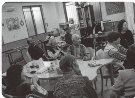
地域と施設の交流の場です

毎週月曜日 13:00～16:30 デイサービスさくらの希 高師浜1-8-13 参加費 100円