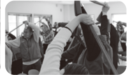
脳トレや体操など、 楽しみもたくさん