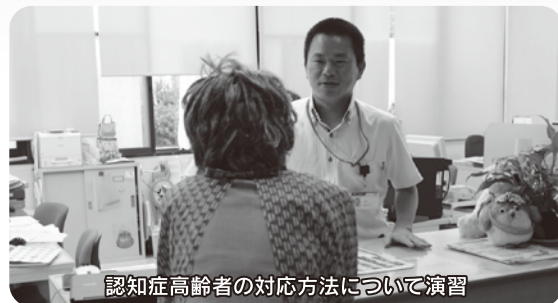
認知症高齢者の対応方法について演習

昨年度より地域住民や地域の団体が、他人事ではなく我が事として参画する“我が事・丸ごと事業”が始まり、互いに支え合う地域共生社会の実現に向けた取り組みを、市と連携しながら進めてきました。今年度からは市内の郵便局全7局が新たに連携の一員として加わりました。地域に身近な郵便局とこれからも連携を深め、高齢者だけではなく、あらゆる市民の困りごとなどにいち早く対応できるように取り組んでまいります。