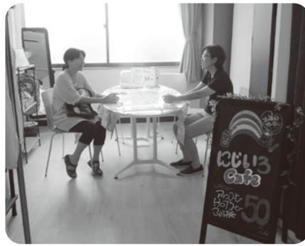
コミカフェを通して、交流を深めませんか

毎週火曜日 9:30～15:30 高石市立ふれあいゾーン内1階 リサイクルショップ ビギン店内 綾園4-5-28 参加費 50円