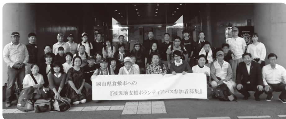
岡山県倉敷市への 『被災地支援ボランティアバス参加者募集』