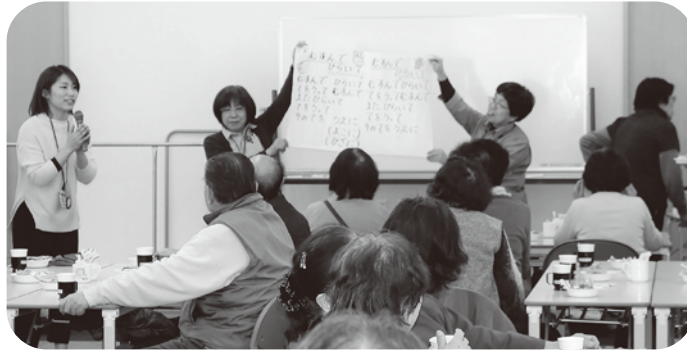
お茶を飲みながら、お喋りにも華が咲きます

毎月第4月曜日 13:30～15:00 綾井自治会館 綾園2-2-41 参加費 100円