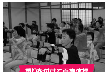
重りを付けて百歳体操