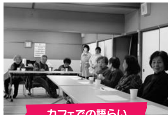
カフェでの語らい