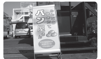
正面入口 パン売り場があって、和やかな賑わいを感じます

紙を切ったりする仕事をした。その時に私が「これしようか・・・」と言ったら、じっとしていた方が笑顔になって一緒にやってくれた。そのうち、言葉をうまく話せない方々が、何を伝えたいのかわかってきた。こうしたことが、非常に嬉しかった。ここでの実習体験は、自分の将来の選択肢の一つになった。とても大変なことがわかったが、それだけに、こうした方々へのお世話などが、できたらいいなあ・・・と感じた。