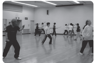
羽衣公民館での練習風景

を正しくして胸を張り、下腹に力をいれて腹式呼吸。そして、バランスのとれた大きくしなやかな動きをすることで、骨格を支える筋肉が強化される…。身体の悪い人でも、その人に合った技をだんだん覚えてもらう。努力を続けたら効果がある。視力が良くなる、血圧が安定するなど運動機能低下が回復する…とのお話。