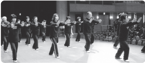
2011年3月 ボランティアフェスティバルでアブラに出演

を正しくして胸を張り、下腹に力をいれて腹式呼吸。そして、バランスのとれた大きくしなやかな動きをすることで、骨格を支える筋肉が強化される…。身体の悪い人でも、その人に合った技をだんだん覚えてもらう。努力を続けたら効果がある。視力が良くなる、血圧が安定するなど運動機能低下が回復する…とのお話。