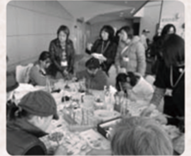
男性会員が料理を作りたいとの要望に、年4回旬の食材を使った料理教室を開催しています。

会員同士何でも楽しく話し合え、元気な「NPO 法人やまびこ」を紹介します。平成10年3月に設立し、会員15人で活動しています。少しでも高齢者の楽しめる場所があればと考え努力しています。 中央公民館・第3金曜日 午後1時より、やつほー倶楽部として絵手紙教室を開いています。参加者は約20人、季節にあった絵手紙とお喋りしながらのティータイムを楽しんでいます。また、ボランティアフェスティバルでは、軍手にアンパンマンなどを書き「孫に喜んでもらえた」などの声を聞き、やりがいを感じています。